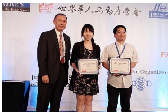
最佳论文奖颁奖现场