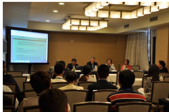
分论坛现场：给青年学者的建议