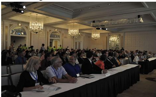
开幕式（欢迎致辞暨主旨演讲）现场

土地市场研讨（一）。7月9日下午的分组专题研讨包括：房地产经济学（三）、住房价格（三）、商业房地产（二）、Networking Room、土地市场研讨（二）、住房按揭及房地产金融、住房价格（四）、土地市场研讨（三）、住房价格及泡沫、商业房地产及房地产企业、Networking Room、城市化进程（二）、绿色建筑和乡村住房。会议结束后，会议主办方举办了闭幕晚宴及保龄球之夜，庆祝本届世界华人不动产学会2015年会暨2015全球不动产峰会取得圆满成功。